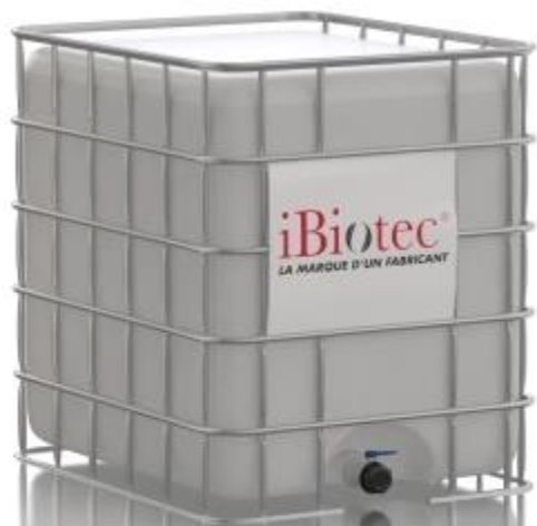
Contenedor GRG 1000 L