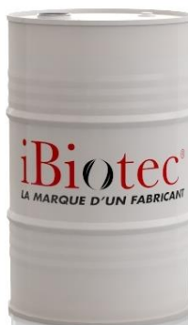
Barril 200 L